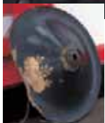
亀千代が使用したと伝えられる陣笠