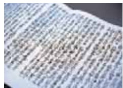
亀千代の最後を伝える古文書の写本

今から約400年前の天正19年(1591)、奥州武士の誇りを守るため、九戸政実は豊臣秀吉が差し向けた大軍を九戸城で迎え撃った。政実が世継ぎと定めた亀千代も鎧を身に付け、天晴れな若武者ぶりを示したに違いない。