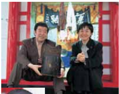
若宮八幡宮で亀千代着用とされる黒革胴を手に